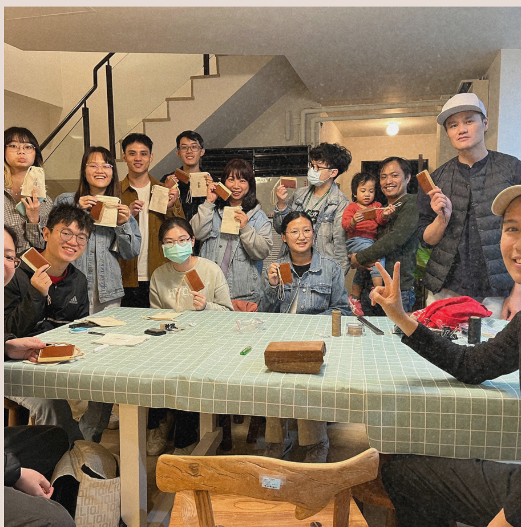
113/3/13 傳統工法編織卡套