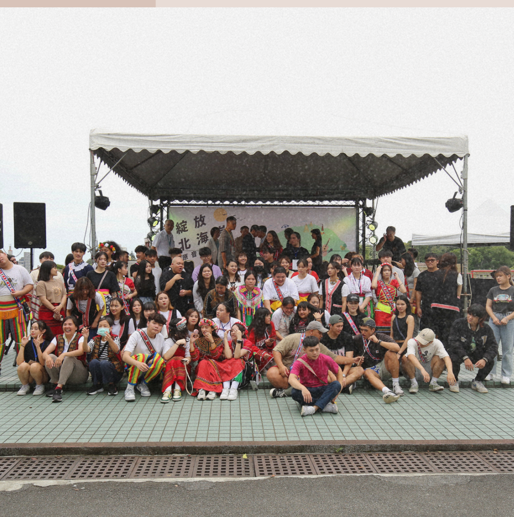
113/5/20 綻放北海岸-原音有你