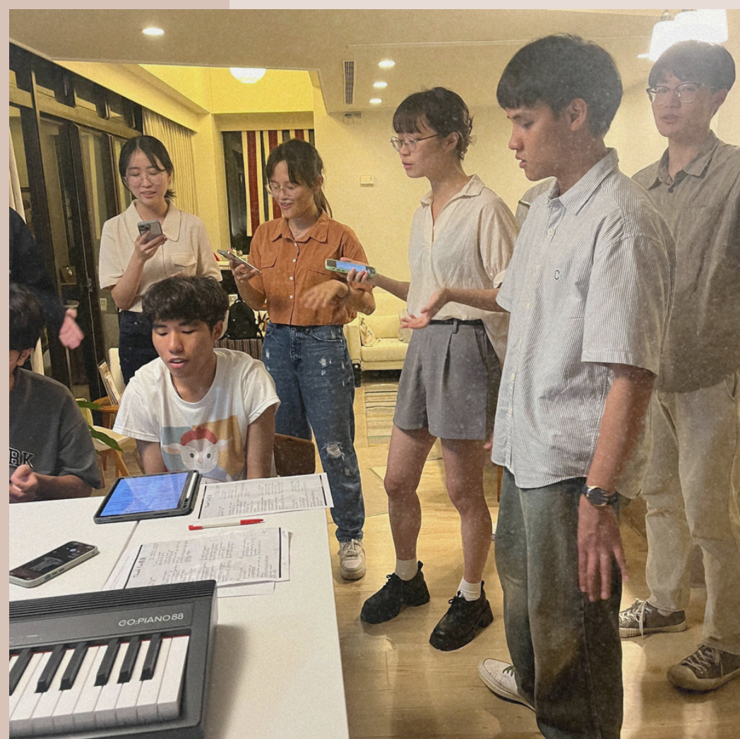
113/3/5/6 社課-排灣族歌謠教唱