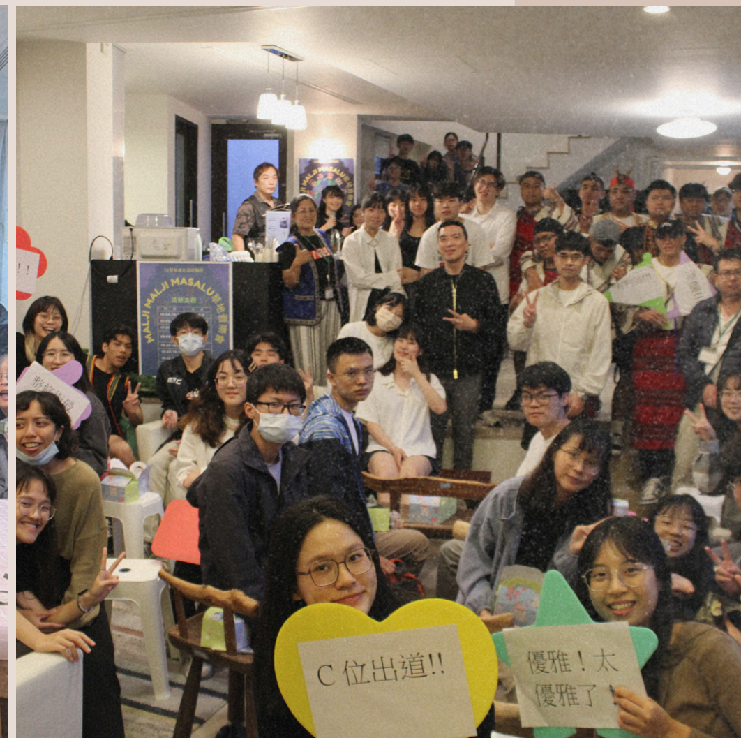
113/5/13 北海岸聯校-草地音樂會