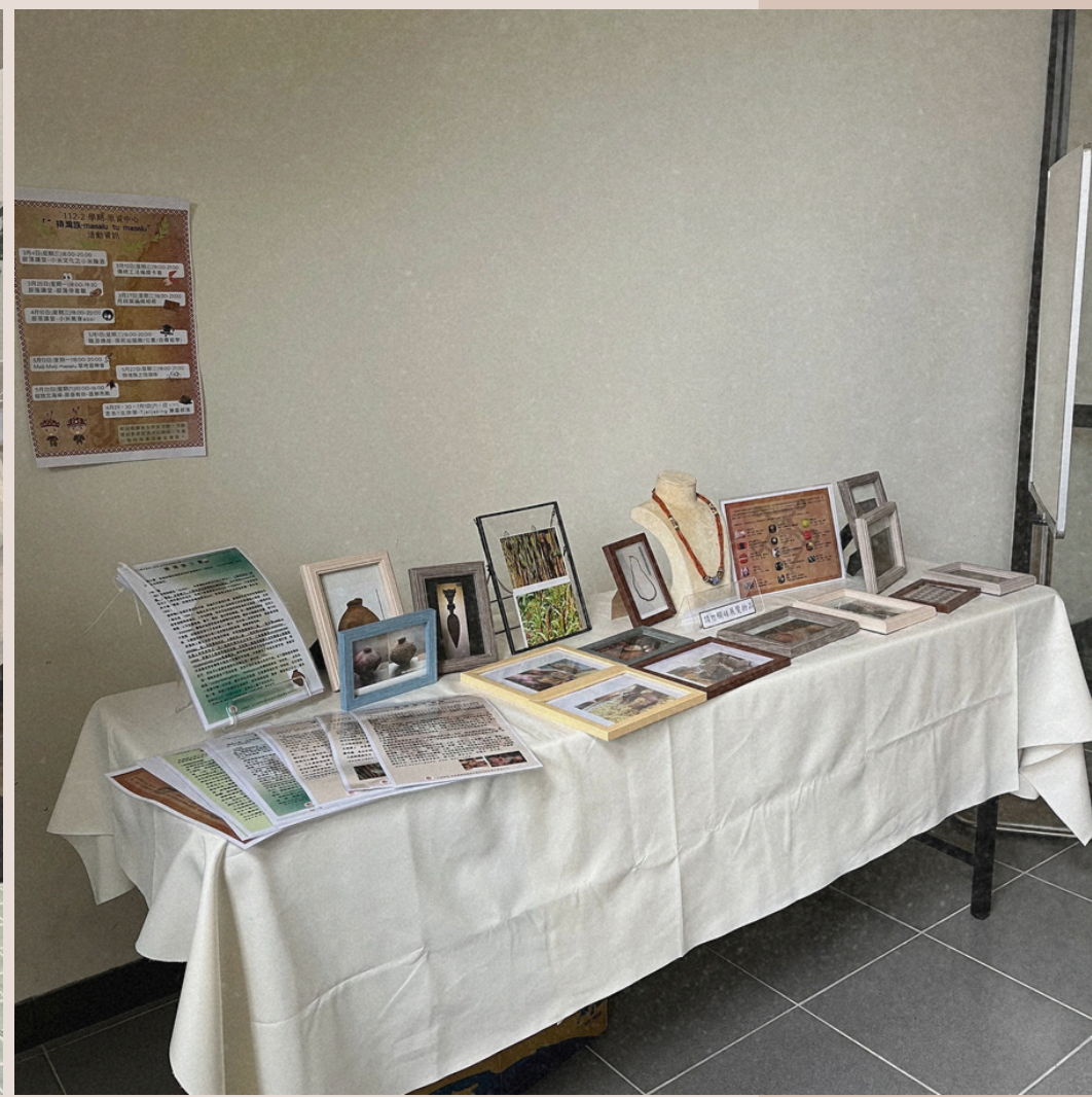
113/3/4-15 Malji malji masalu 靜態展