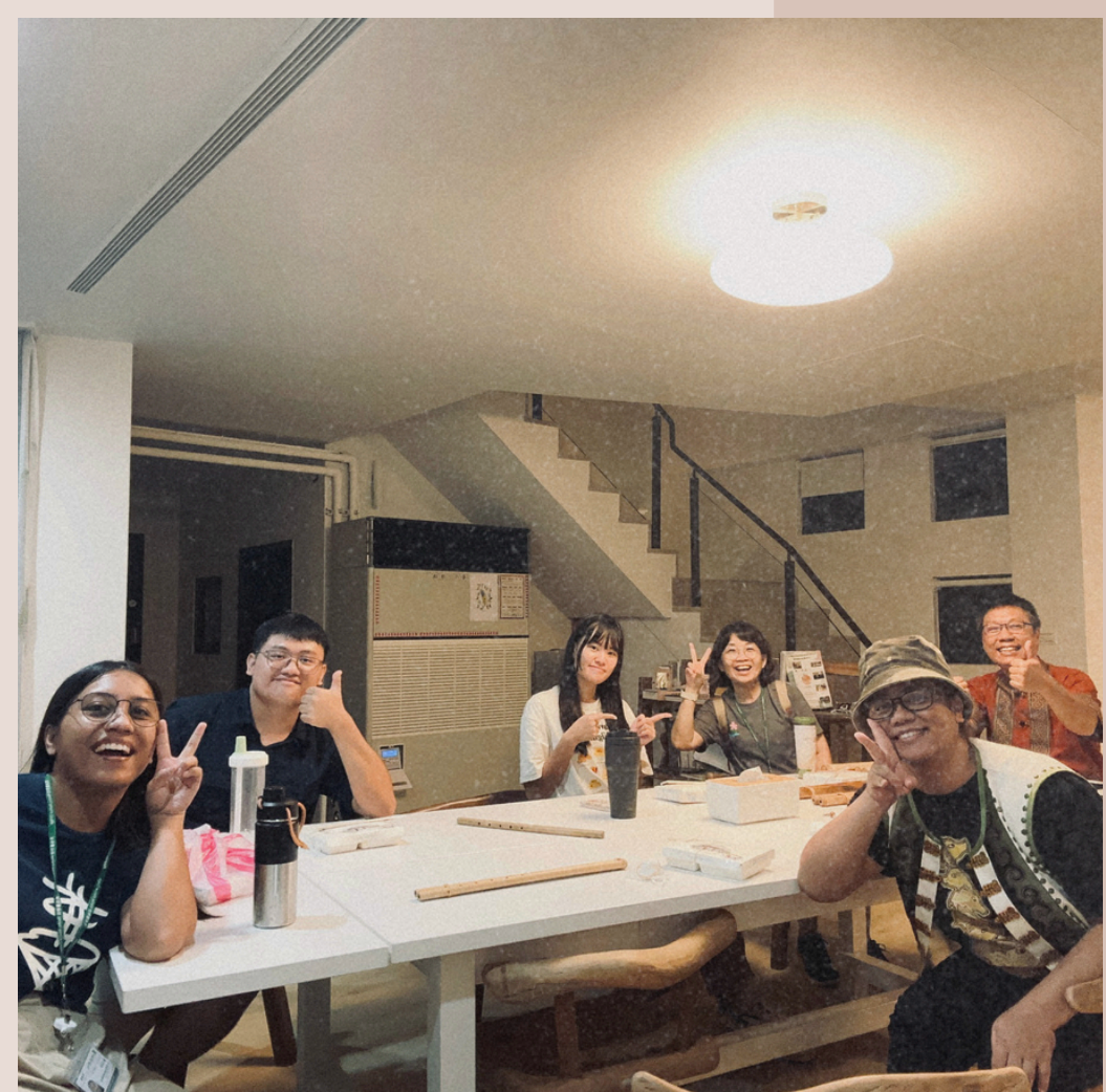
113/9/23 鼻笛背景文化及體驗