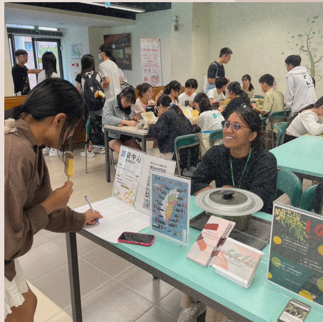
113/9/30-10/2 原資中心業務推廣