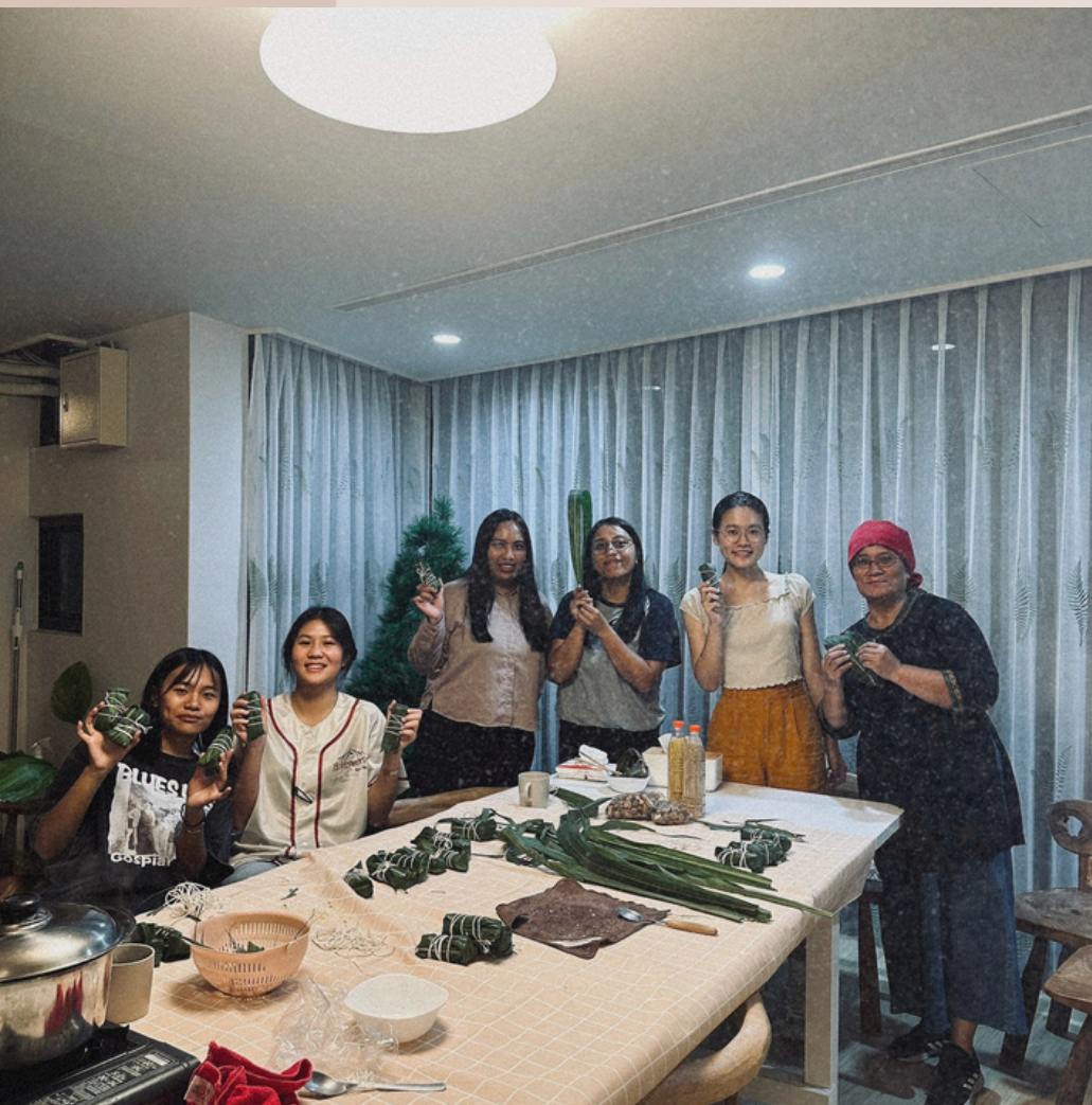
113/9/25 傳統美食x族語小教室