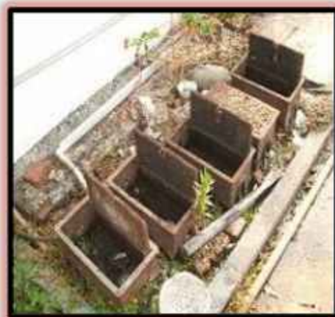
防火巷內廢棄水錶